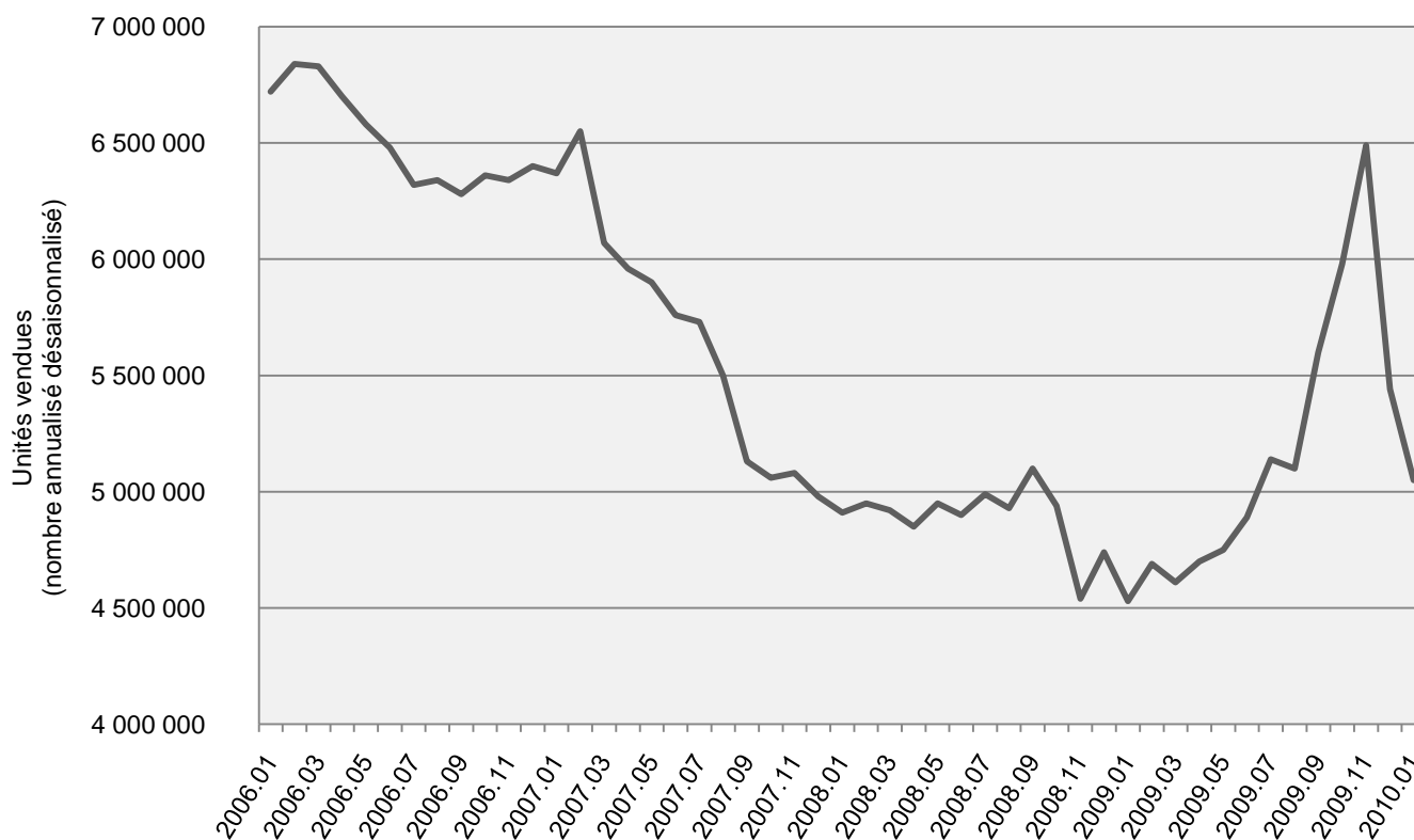
Évolution du marché de la revente aux États-Unis